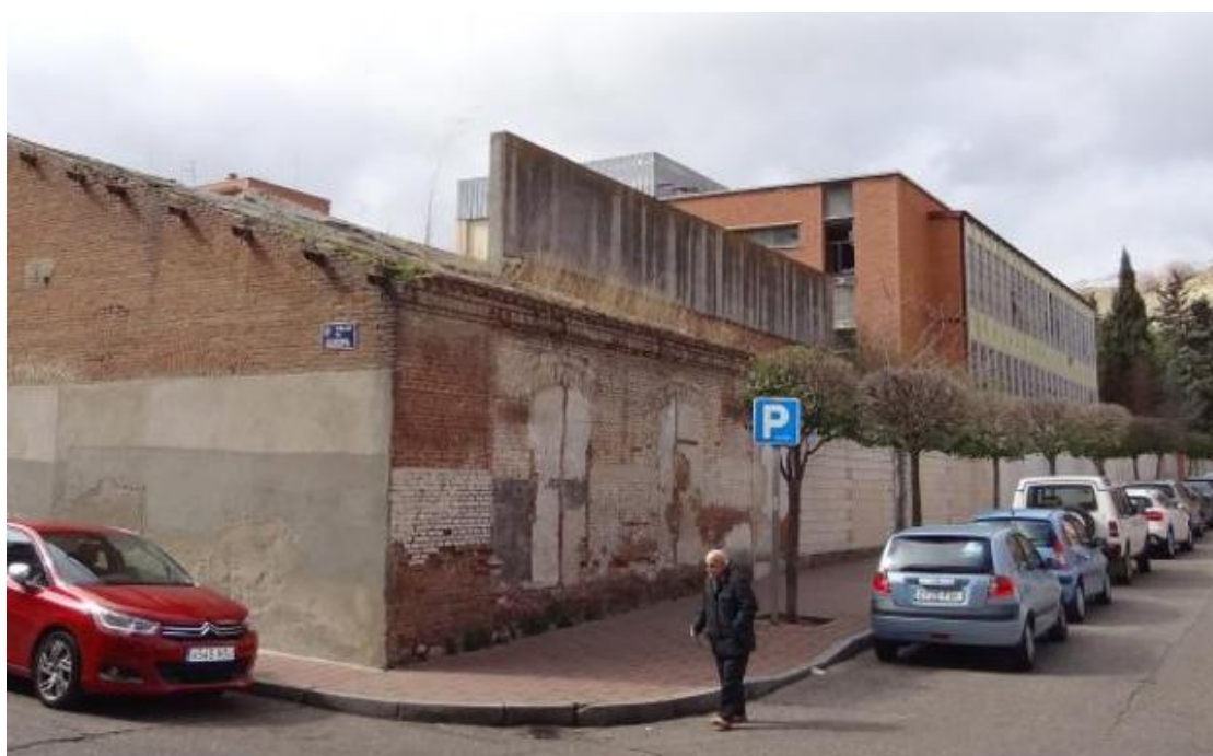
Exterior de la planta de Ovosec en la esquina de la calle Europa.