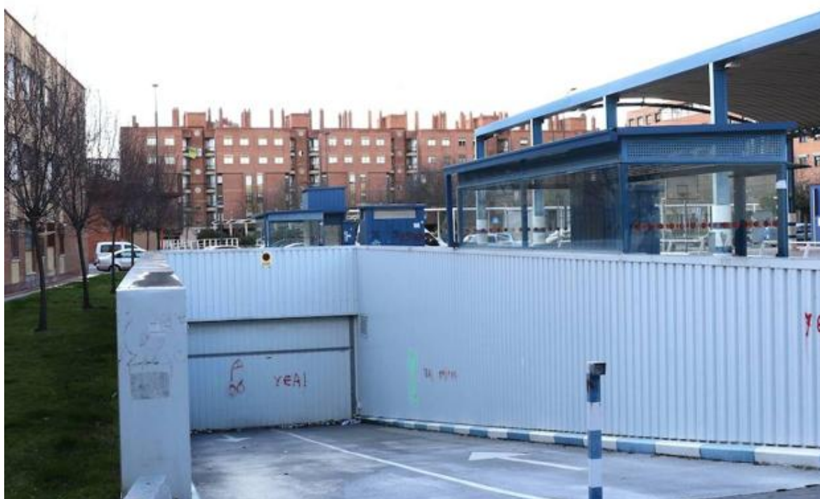
Aparcamiento de la plaza de la Solidaridad, en La Victoria.