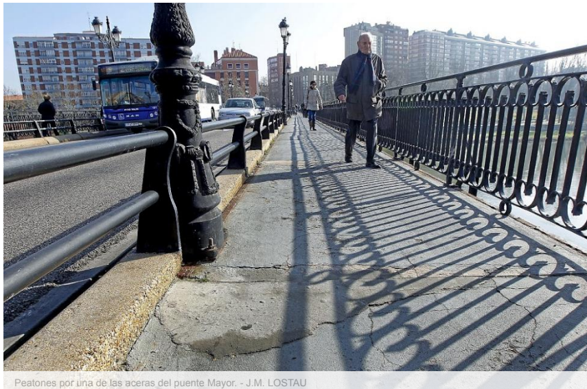
Peatones por una de las aceras del puente Mayor.