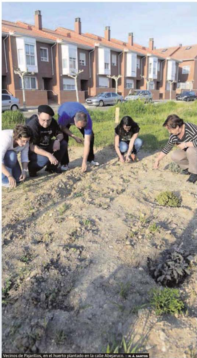
Vecinos de Pajarillos, en el huerto plantado en la calle Abejarcu.

VALLADOLID. El cultivo de tomates o calabacines en plena ciudad ya no es solo un mero pasatiempo para jubilados -con ese espíritu nacieron los huertos urbanos de INEA en 2005- ni una iniciativa que prime solo el ocio. Además de urbanos, los huertos han ganado nuevos apellidos. Ahora también son ecológicos, solidarios, compartidos, de autoabastecimiento... Y numerosos colectivos (vecinales, parroquiales, de desempleados o de familias de alumnos) han visto en la agricultura urbana una nueva herramienta para darle un quiebro a la crisis. Las iniciativas proliferan en la ciudad -también en los pueblos- y el Ayuntamiento (a instancias de Parados en Movimiento y después de una pregunta de IU en el último pleno) ha anunciado que elaborará un catálogo de solares disponibles para llevar los huertos urbanos a los barrios. «En primer lugar haremos un inventario de las parcelas que no tengan uso ni destino específicos», explica Domi