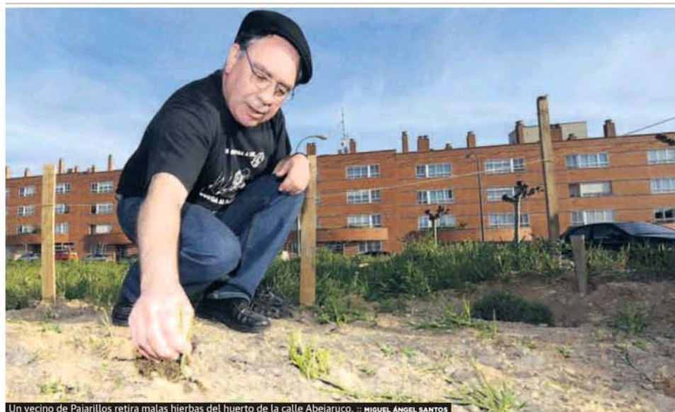
Un vecino de Pajarillos retira malas hierbas del huerto de la calle Abejaruco.

Castilla y León tiene 258.451 viviendas vacías, 50.000 más que hace diez años P46