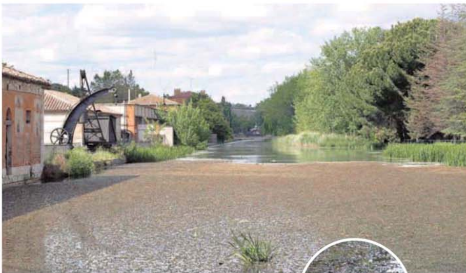
Acumulación de algas y suciedad en la dársena del Canal de Castilla. de Marco Gómez

Son intervenciones «básicas» que reclaman los vecinos de la zona, toda vez que la Confederación Hidrográfica del Duero (CHD) anunció el pasado 16 de abril (así lo publicó el BOE) que renunciaba