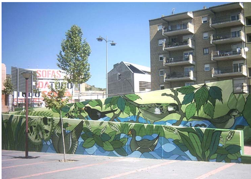
Pájaros, flores y plantas típicas de la zona componen el mural de una de las pasarelas

Así, quien se acerque por el parque podrá ver pájaros, peces, labradores de las eras o las lavanderas del río, entre otros muchos dibujos. Una forma de pintar poco habitual en Valladolid pero que ha tenido una buena acogida por parte de los vecinos. “A mí me gusta este tipo de técnica porque es una forma de interactuar con la gente. De hecho, el 97 por ciento de los ciudadanos que me han visto pintando han reaccionado de forma muy positiva. Sólo