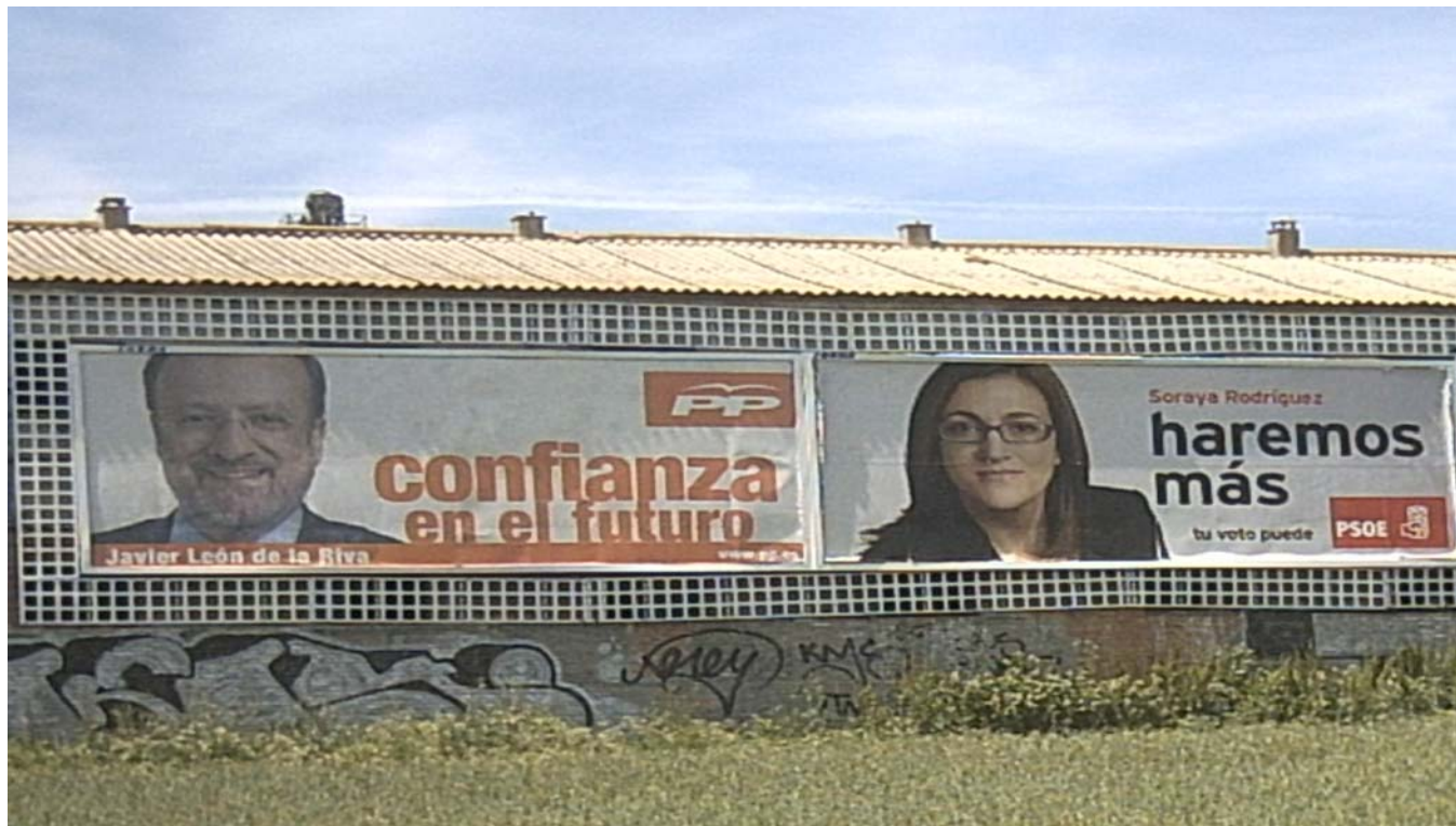
Dos vallas publicitarias con los anuncios de los principales candidatos de la Alcaldía de Valladolid.

Durante 15 intensos días, los candidatos a la Alcaldía de Valladolid han recorrido cada rincón de la ciudad con una mochila cargada de promesas que comunicaban a los ciudadanos en cada acto electoral y mitin. Pero, ¿qué prometen para los barrios vallisoletanos? ¿Y para el nuestro?