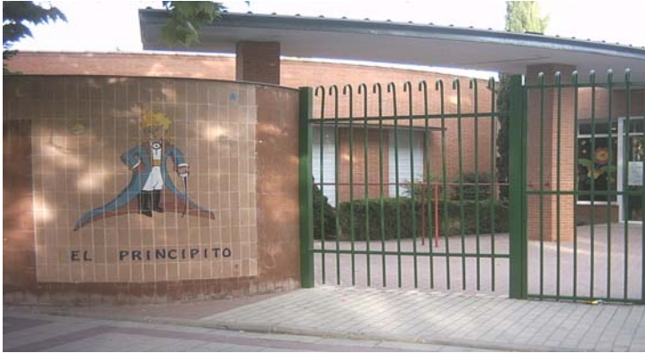
Entrada de la escuela municipal "El Principito"

Tanto las asociaciones de vecinos como las AMPAS exigen al Ayuntamiento más plazas infantiles públicas de 0 a 3 años