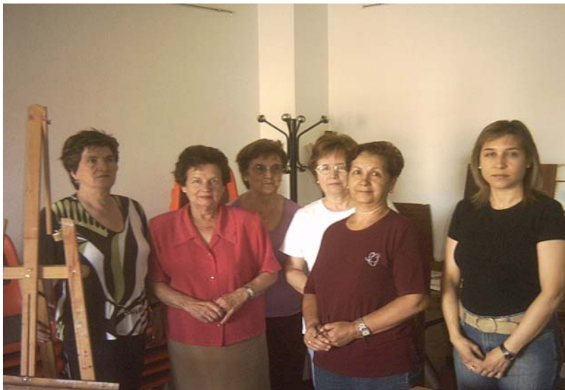
La nueva directiva compuesta sólo por mujeres. Abajo, miembros del taller de rondalla

El segundo gran proyecto es el denominado "Viviendo vivo", que tiene su reflejo en todas las actividades externas que se realizan a lo largo del cur-