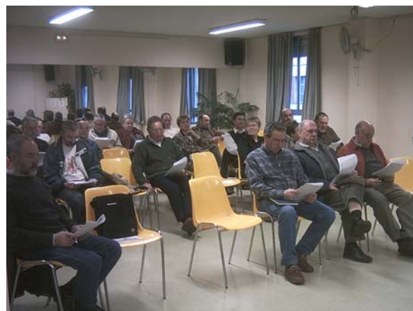
Dos momentos de la Asamblea de socios que tuvo lugar el pasado 27 de marzo.