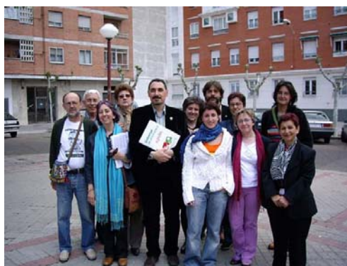
La candidatura de IU– Los Verdes eligió la Plaza del Cosmo del barrio La Victoria para la foto oficial de la campaña

“Todos los partidos han salido a la calle para llevar a los ciudadanos sus promesas electorales”