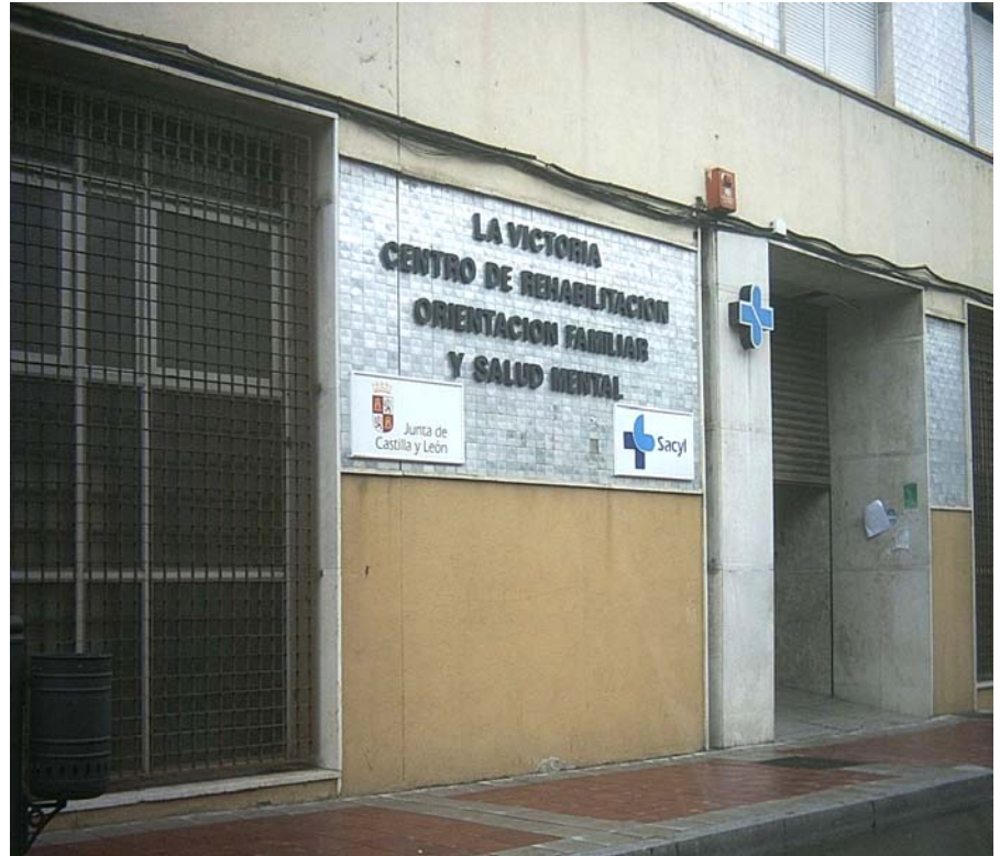
Imagen del centro de salud en la Avenida de Burgos.

Cuando los habitantes del barrio vean este sueño hecho realidad, atrás quedarán las manifestaciones frente a la antigua