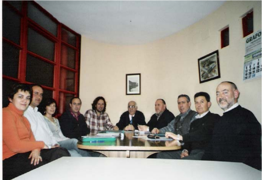
Las directivas de ambas asociaciones de vecinos se reunieron para discutir sus problemas comunes.

En el encuentro se decidió mantener una buena comunicación entre las dos