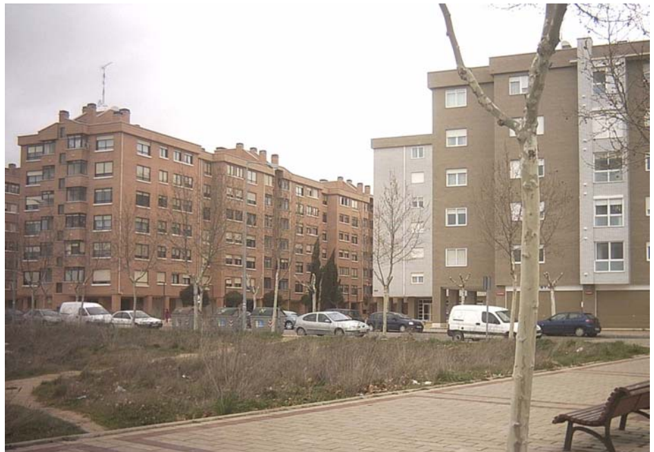
Vista de la zona residencial de Puente Jardín.

- Compartimos varios puntos en común con La Victoria, como la dejadez del Canal en cuanto al mantenimiento y a la seguridad; no hay ninguna valla y es un peligro para los niños; la apertura de una calle que dé salida desde Puente Jardín a la Avenida de Burgos, la llegada de las líneas C1, C2 y 10 hasta Puente Jardín, porque ahora llegan hasta la Plaza de la Solidaridad y sólo serían tres minutos más, arre-