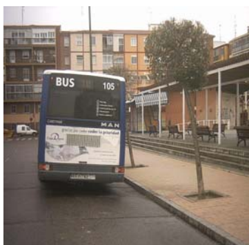
Autobús número 10

- En el barrio de Parquesol: nace en la calle Ciudad de la Habana, recorre Hernando de Acuña, a la altura del número 46, sigue por Martín Santos Romero, frente al campo José Luis Saso y a la altura de los números 60 y 140, por Felipe Ruiz Martín y por Manuel Canesí Acevedo, hasta llegar a la Avenida de Salamanca. - En la zona de Arturo