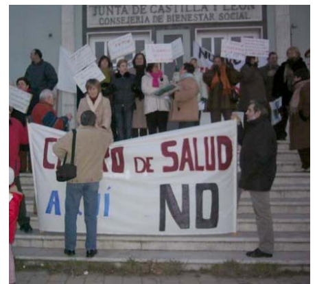
Una de las manifestaciones de los vecinos pidiendo el nuevo centro de salud

La candidata socialista, Soraya Rodríguez, en su visita al barrio se comprometió a construir el ansiado centro de salud, conocedora de que es una antigua reivindicación del barrio de la Victoria. Igualmente, en la primera reunión mantenida con la nueva asociación de vecinos de Puente Jardín, se ha puesto en común este problema, ya que ellos también exigen un centro de salud ¡ya!